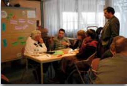
Workshop tweede zorgring, gespreksta- fel WWZ-teams.

gring. Deze twee moeten tijdens incidenten beschikbaar zijn. Vaak zijn er 24 uursvoorzieningen in zowel de crisisbeheersingsorganisatie als de tweede zorgring, die de contactpersonen kunnen leveren.